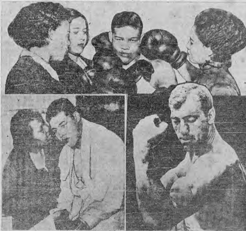
Arriba: Joe Louis con sus tres hermanas; abajo, a la izquierda: Joe Louis con su madre; a la derecha: Carnera, quien con todo y los enormes "biceps" que muestra, fue noqueado anoche por su negro contricante.

LOS GOLPES DE JOE A CARNERA PARECIAN EXPLOSIONES DE DINAMITA. CONSIDERADO JOE DESDE A HORA, COMO EL PROXIMO CAMPEON MUNDIAL DE TODOS LOS PESOS