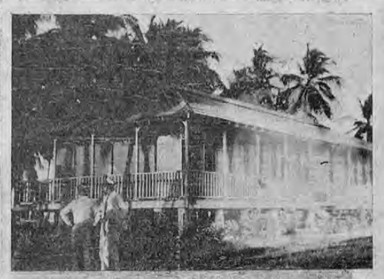
Desde la fecha de hoy comenzará a llegar banano del que se produce en las vegas del Río San Juan para ser embarcado en los muelles de este puerto hacia los mercados del exterior.

Se embarca por Limón el banano que se produce en las vegas del Río San Juan. Setenta mil racimos llevó el vapor PETEN que salió el último domingo.