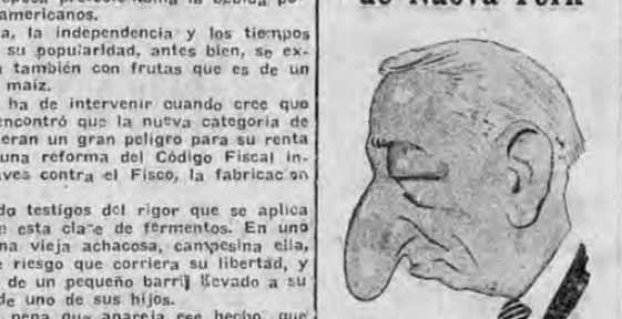
ALFRED EMMANUEL SMITH