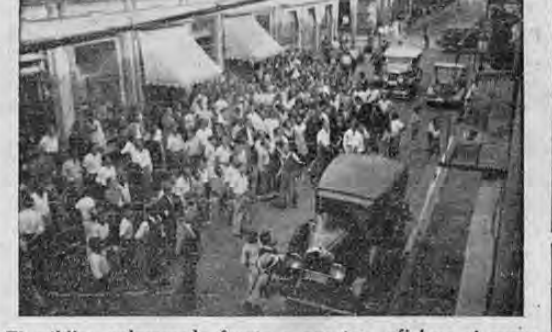
El público aglomerado frente a nuestras oficinas al sonar la sirena anunciando la catástrofe de Medellín

ELLO OBEDECE, INDUDABLEMENTE, A QUE SOLO "LA TRIBUNA" CUENTA CON UN SERVICIO PAGO Y PERMANENTE DE NOTICIAS EXTRANJERAS